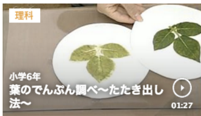
葉のでんぷん調べ たたき出し法 1分27秒

https://www.nhk.or.jp/school/keyword/?kw=%E3%82%BC%E3%83%A9%E3%83%8B%E3%82%A6%E3%83%A0