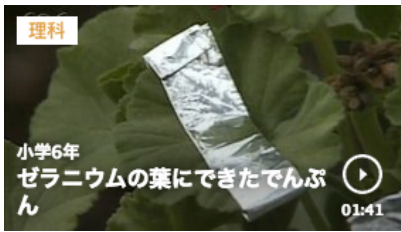
ゼラニウムの葉にできたでんぷん 1分41秒

https://www.nhk.or.jp/school/keyword/?kw=%E6%A4%8D%E7%89%A9%E3%81%AE%E8%92%B8%E6%95%A3