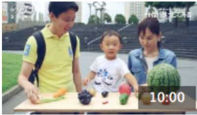
カガクノミカタ 仲間分けしてみる 10分

https://www.nhk.or.jp/school/keyword/?kw=%E9%87%8E%E8%8F%9C%E3%81%AE%E6%A0%B9