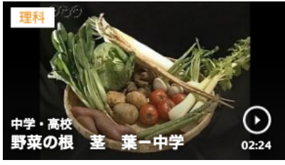
野菜の根・茎・葉 2分24秒

https://www.nhk.or.jp/school/keyword/?kw=%E5%BA%83%E3%81%8C%E3%82%8B%E6%A7%98%E5%AD%90