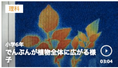
でんぷんが植物全体に広がる様子 3分04秒

https://www.nhk.or.jp/school/keyword/?kw=%E3%81%9F%E3%81%9F%E3%81%8D%E5%87%BA%E3%81%97