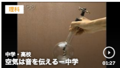
空気は音を伝える（真空実験） 1分27秒

https://www.nhk.or.jp/school/keyword/?kw=%E7%A9%BA%E6%B0%97%E3%81%AF%E9%9F%B3