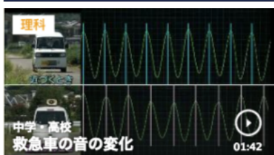
救急車の音の変化 1分42秒

https://www.nhk.or.jp/school/keyword/?kw=%E9%9F%B3%E3%81%8C%E9%81%85%E3%82%8C