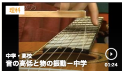
音の高低と物の振動 1分24秒

https://www.nhk.or.jp/school/keyword/?kw=%E7%A9%BA%E6%B0%97%E3%81%AF%E9%9F%B3