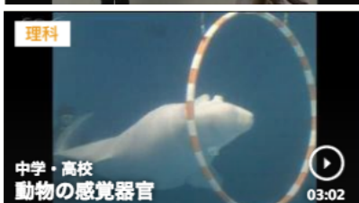
動物の感覚器官 3分02秒

https://www.nhk.or.jp/school/keyword/?kw=%E4%BC%9D%E3%82%8F%E3%82%8B%E9%9F%B3