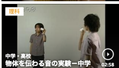
物体を伝わる音の実験 2分58秒

https://www.nhk.or.jp/school/keyword/?kw=%E8%80%B3%E3%81%AE%E3%81%97%E3%81%8F